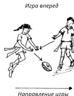
Рисунок 2. Схема паса вперед.