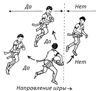
Рисунок 1. Схема паса вперед.

Захват (ТЭГ) — захват (ТЭГ) — это простое срывание защитником одной или двух лент с игрока, владеющего мячом.